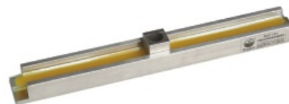
干燥时间用玻璃条涂膜导轨