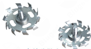
重型分散盘 适用于高黏度样品