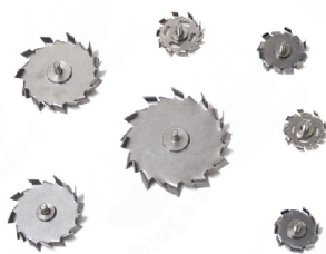
高效分散盘 适用于低黏度样品