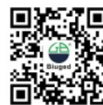
微信扫码，乐享视频