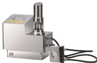
微量耐腐蚀循环进样器