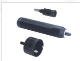
电动专用切割器及切割头