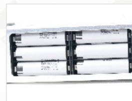
内置可充电锂电池