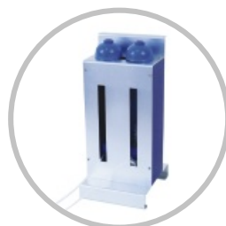
洗刷介质容器+容器架