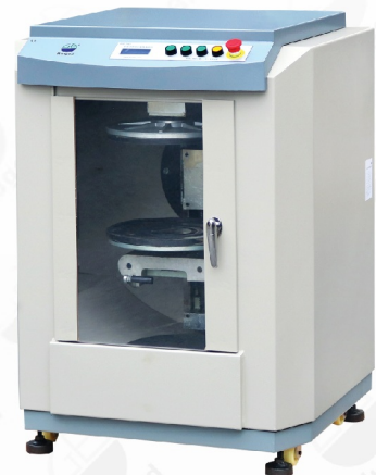
BGD 764/3 全自动密闭式旋转混合机