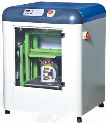
BGD 763/1 密闭式涂料震荡机