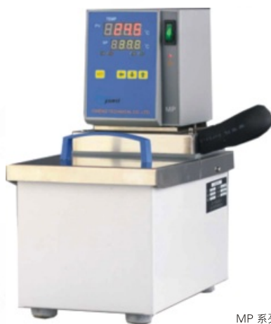
MP系列水槽带外循环！