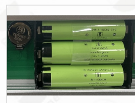
内置可充电锂电池