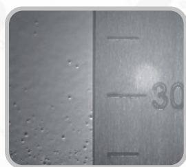
样品粒子分布高清图像